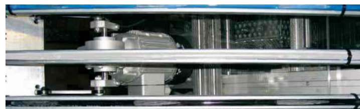
igus® test zaměřený na otěr materiálu

Dostupné skladem, dodávky do 24h nebo dnes. Dodací lhůta znamená čas potřebný k odeslání z výrobního závodu